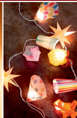
Kreativwerkstatt für Kinder