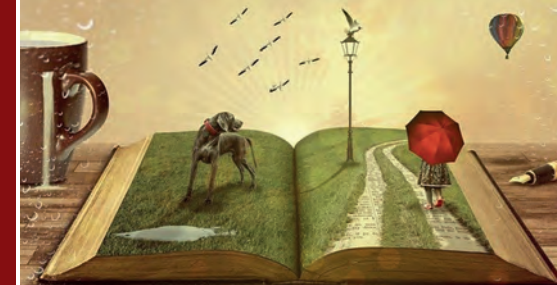
Schreiblust: Schreibwerkstatt für Jugendliche