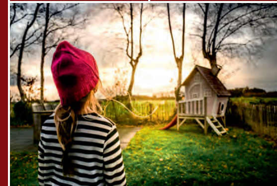
Garten der Kindheit: Schreibwerkstatt für Erwachsene