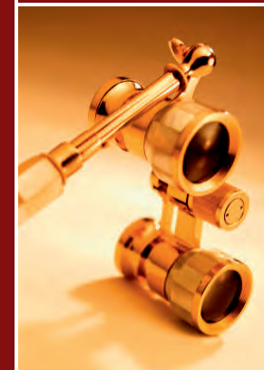
Einführung in die Oper