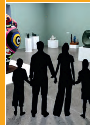
Kunstspaß: Sprengel Museum