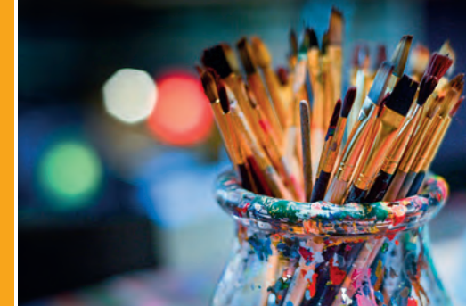
Kreativwerkstatt: „Zwei bis Zehn“