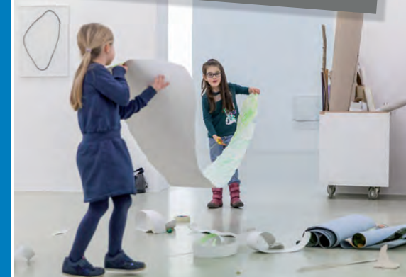
Kunst-Schnuppern für Kinder