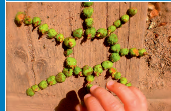
AtelierNatur für Kinder