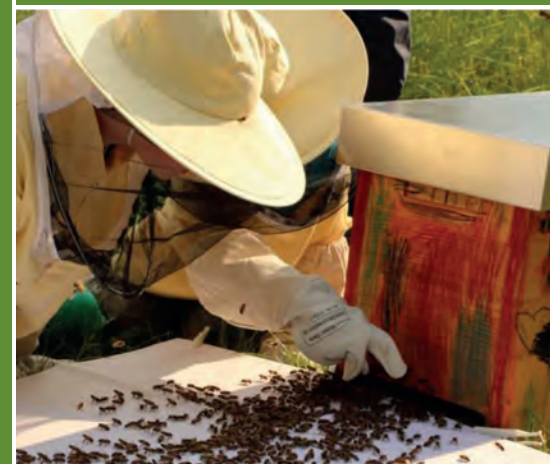
Faszination Honigbienen: Familienausflug & Workshop für Kinder