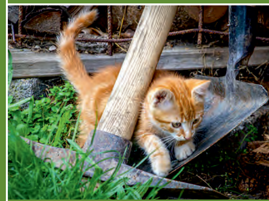
„Film-Freitag“ für Familien mit Kindern ab 5 Jahren