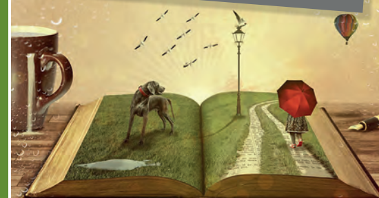
Schreibwerkstätten für Kinder, Jugendliche & Erwachsene