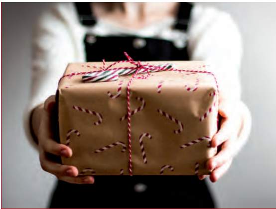
Geheime Weihnachtswerkstatt für Kinder