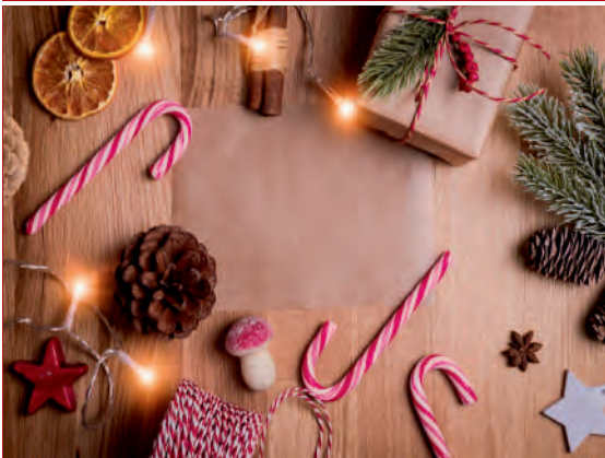
Kreative Bastelzeit für Erwachsene