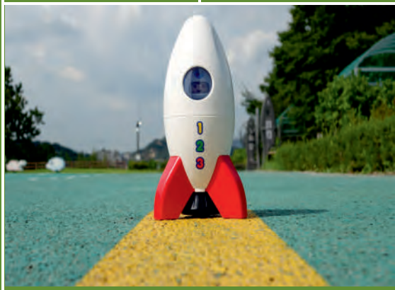
Weltraum-Abenteuer! Foto-Ferienprojekt für Kinder