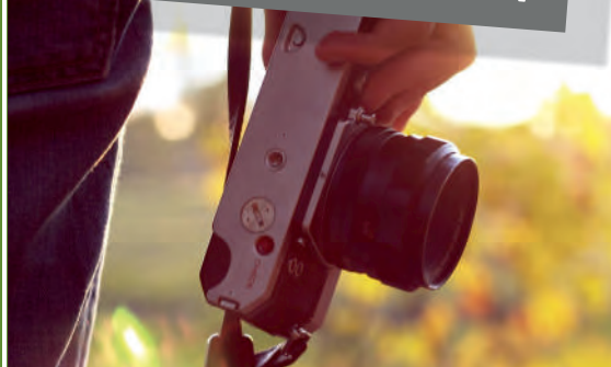
Foto-Wochenend-Kurs für Erwachsene