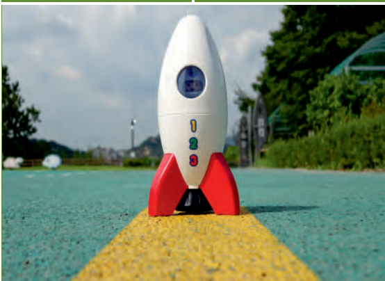
Weltraum-Abenteuer! Foto-Ferienprojekt für Kinder