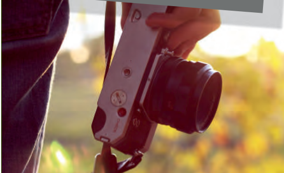
Foto-Wochenend-Kurs für Erwachsene