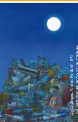
Kunstvortrag mit Gespräch