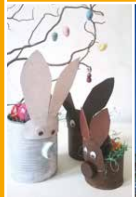
Kreativwerkstatt für Kinder