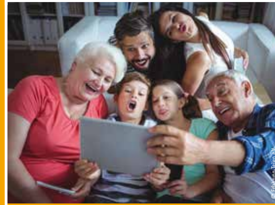
Projekt für Senioren und Seniorinnen: Digital mobil im Alter