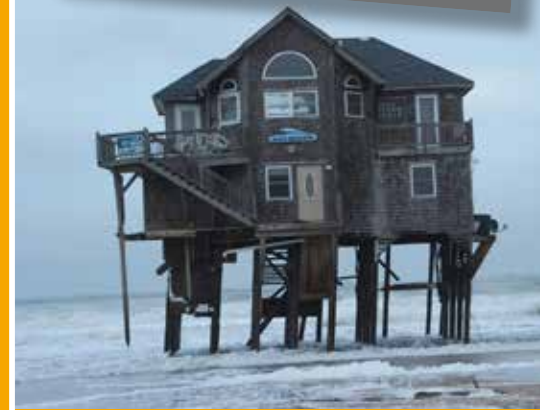
Kindertheaterkurs: Das Haus der merkwürdigen Ereignisse